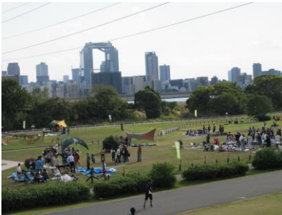
西中島地区のBBQ利用状況