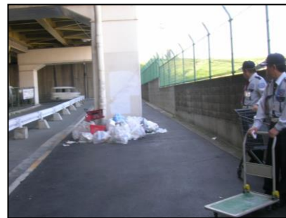
市街地に投棄されたBBQゴミ