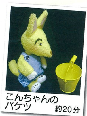
こんちゃんのバケツ 約20分