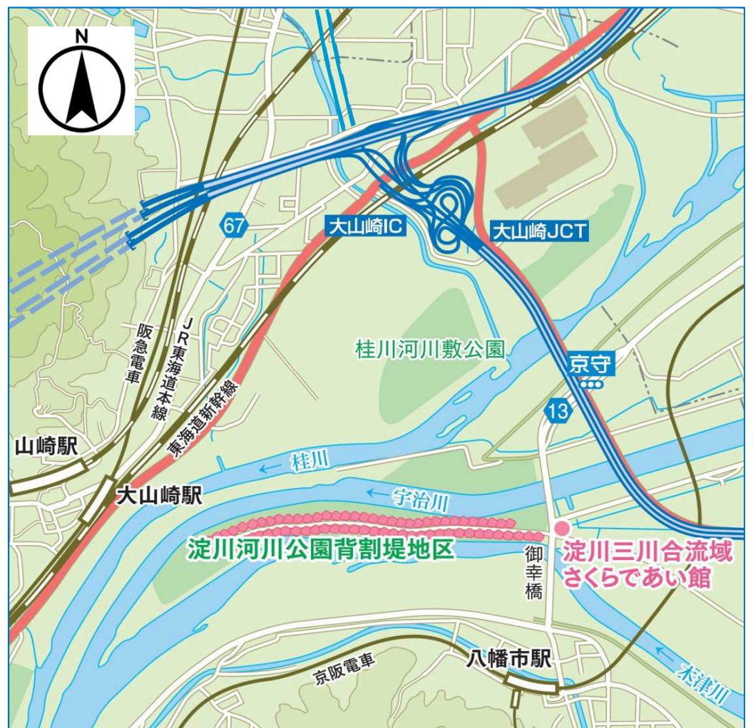
▲背割堤地区案内図