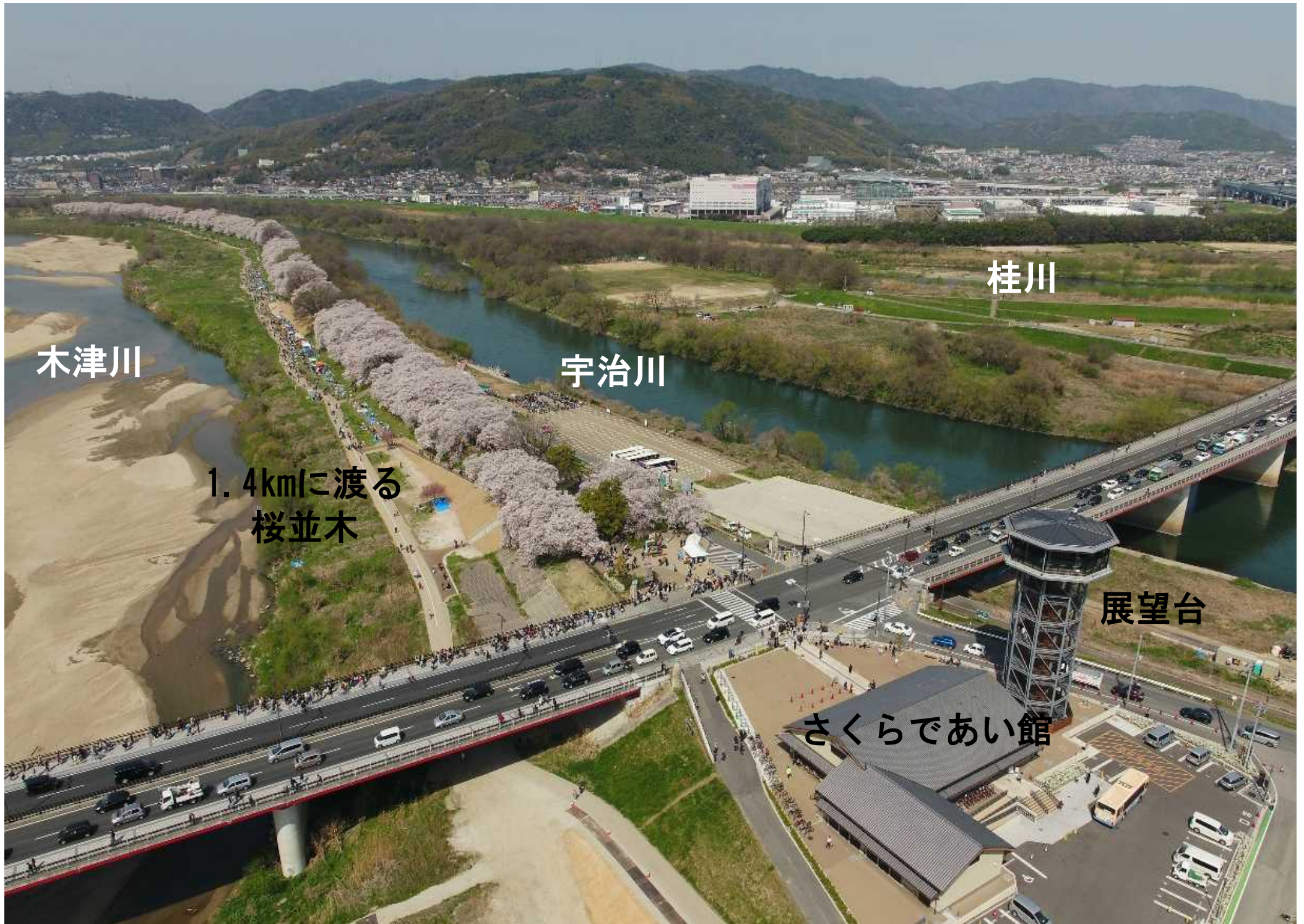
▲御幸橋上流側から下流方向を望む（H30. 4）