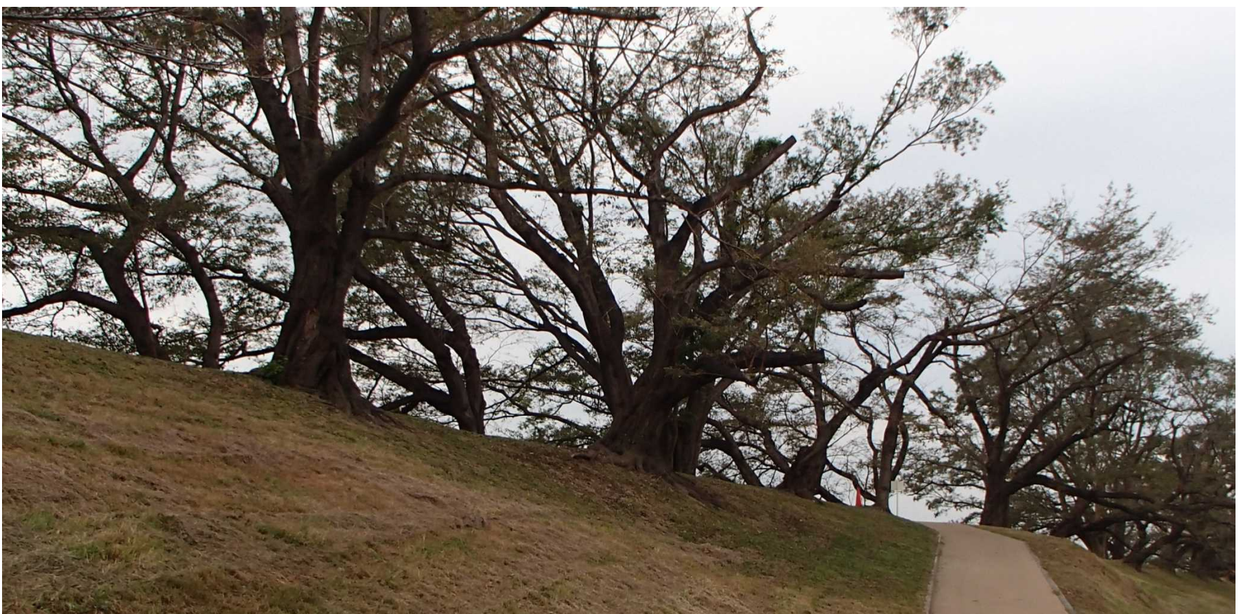
▲木津川側の作業完了状況(下流から上流方向)