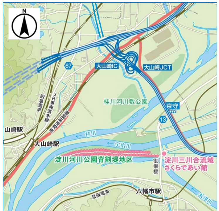
▲背割堤地区案内図