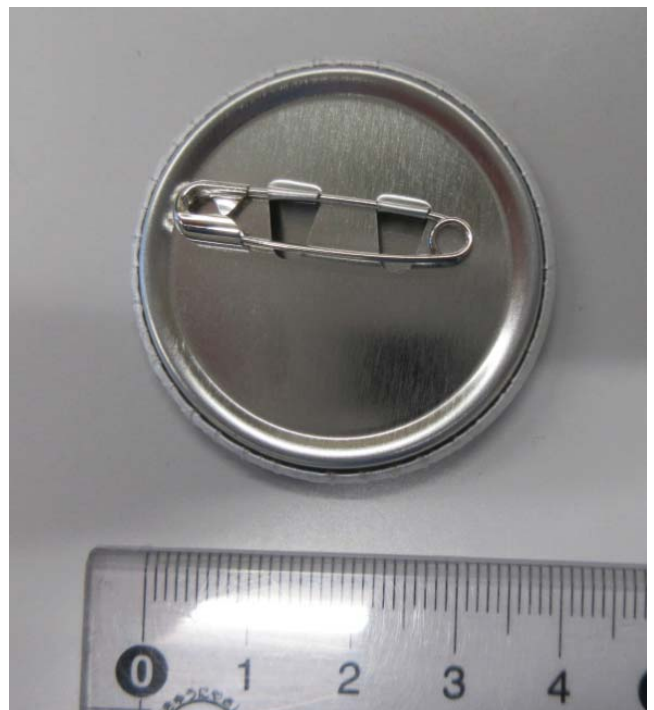
▲300円以上募金頂いた方には、オリジナル缶バッジを差し上げます。 缶バッジのデザインは、期間により種類を変えていきます。 (上の写真は、12月1日～の缶バッジのデザインです。)