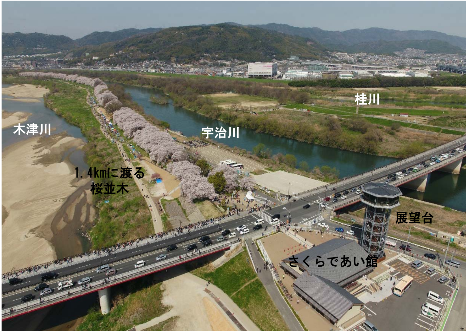
▲御幸橋上流側から下流方向を望む (H30. 4)