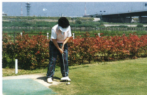
▲パターゴルフ大会