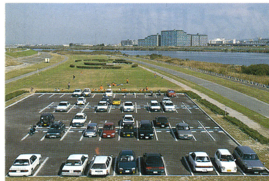
●大阪市バス豊里町下車徒歩5分。