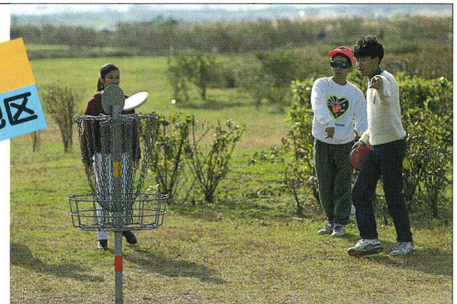
▲仁和寺野草地区のディスク・ゴルフ