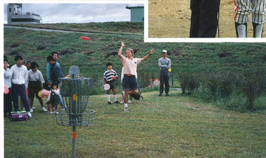
▲ディスクゴルフ大会