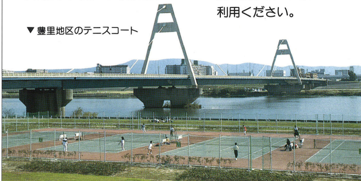
▼豊里地区のテニスコート