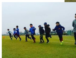
よどがわこども スポーツスクール (サッカー、野球、走り方)