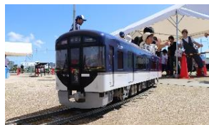
ミニ京阪電車撮影コーナー