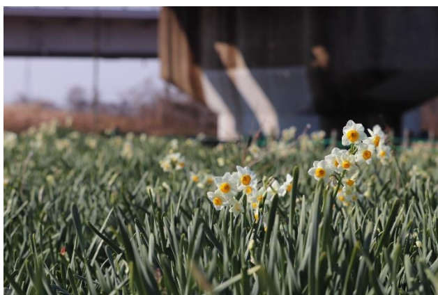
開花状況 令和3年1月13日撮影

花を咲かせたニホンスイセンは独特の爽やかな香りをあたりに漂わせ、来園者を楽しませます。