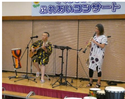
ふれあいコンサート