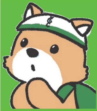
ボランティアセンターマスコットキャラクター まもるくん