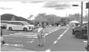
警備員・誘導員の費用