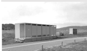
仮設トイレの設置費用